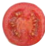
ふつうの中玉トマト